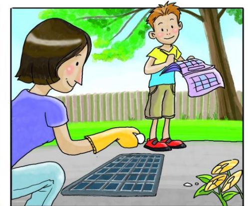
RICORDATI DI TRATTARE I TOMBINI CON PASTIGLIE DI INSETTICIDA, NEL PERIODO DA APRILE A SETTEMBRE. (*)