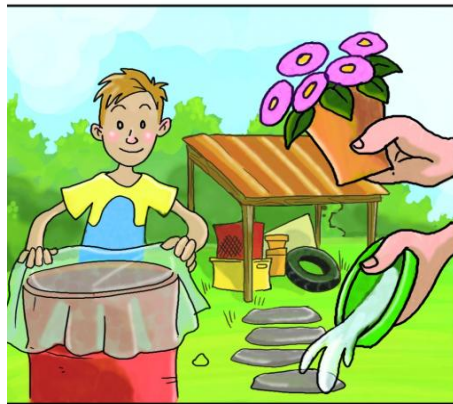
METTI AL RIPARO DALLA PIOGGIA TUTTO CIÒ CHE PUÒ RACCOGLIERE ACQUA.

Il Comune predispone interventi preventivi larvicidi nelle aree pubbliche: tombini, griglie e caditoie. A tale lotta larvicida seguirà una lotta adulticida mirata SOLO in casi di grave e accertata infestazione. Il Comune ha emesso un'ordinanza, reperibile sul sito, che prevede anche sanzioni amministrative per la disattesa di alcune delle regole qui descritte.