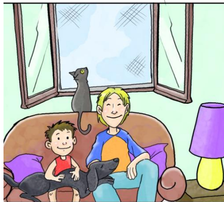
IN CASA USA LE ZANZARIERE ANZICHÉ ZAMPIRONI E FORNELLETTI.