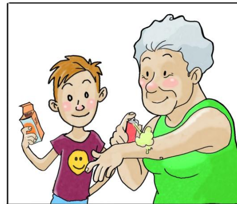
USA I REPELLENTI CUTANEI SEGUENDO LE INDICAZIONI RIPORTATE SULLE CONFEZIONI.