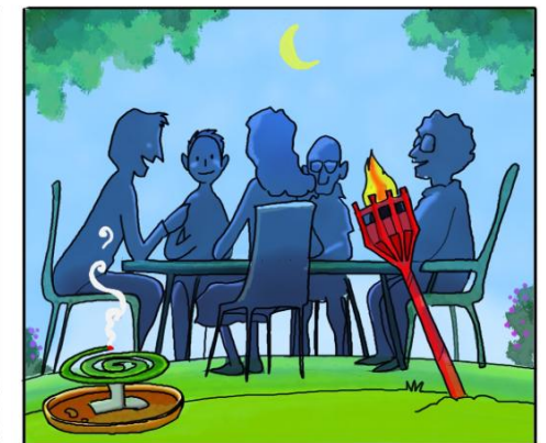
QUANDO SOGGIORNI ALL'APERTO, PROTEGGITI CON REPELLENTI AMBIENTALI. (*)